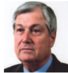
Του Νικόλαου Φωτιάδη Αντιστράτηγου ε.α.

Εν Πασχαλιά τη 14η Μαΐου 1944. Ο Γενικός Αρχηγός».