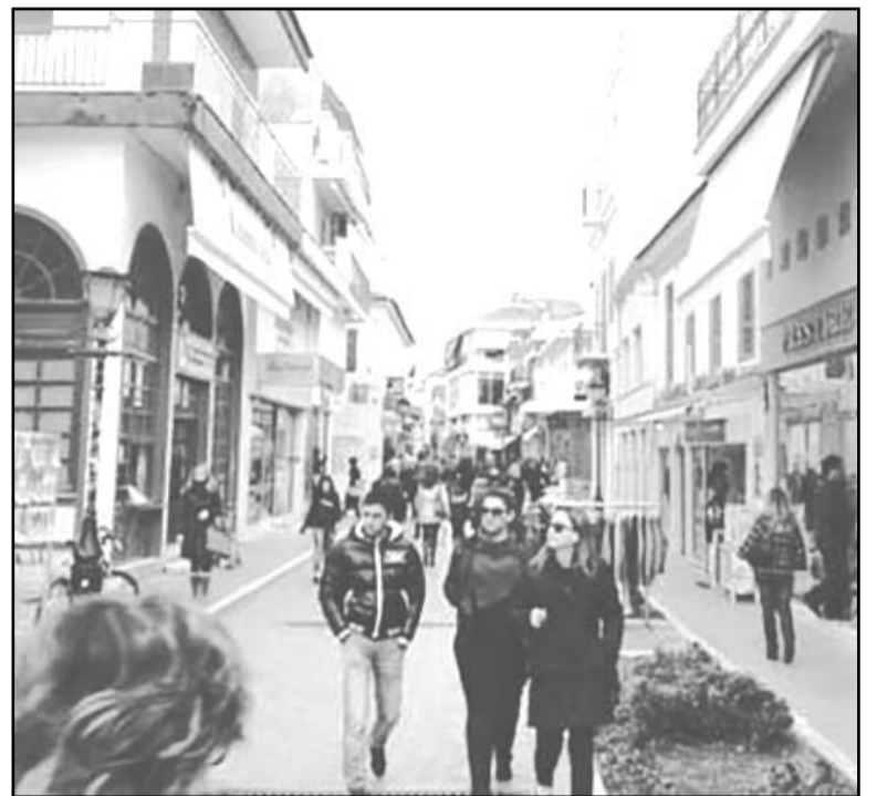
Την περίοδο των εκπτώσεων οι έμποροι στην Πρέβεζα τρέχουν να μαζέψουν τα... «σπασμένα» του Πάσχα

Η υποτονική κίνηση της αγοράς το προηγούμενο διάστημα με τις πωλήσεις να καταγράφουν μείωση, δεν αφήνουν πολλά περιθώρια στους καταστηματάρχες, που επιδιώκουν να «ζεστάνουν» τα ταμεία