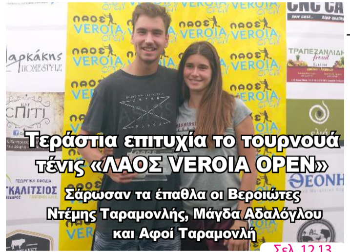
Τεράστια επιτυχία το τουρνουά Τένις «ΛΑΟΣ VEROIA OPEN»