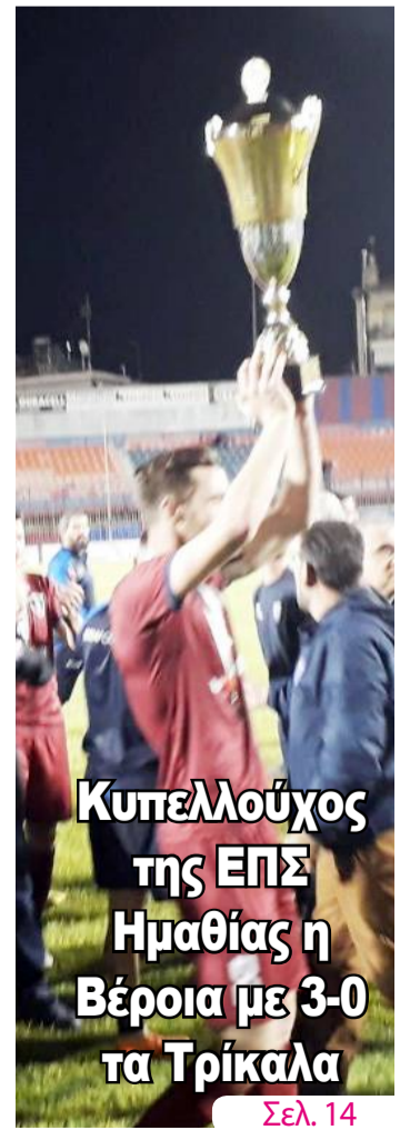
Κυπελλούχος της ΕΠΣ Ημαθίας η Βέροια με 3-0 τα Τρίκαλα