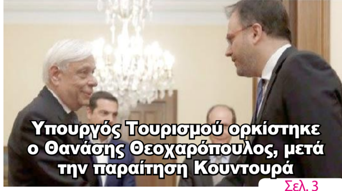
Υπουργός Τουρισμού ορκίστηκε ο Θανάσης Θεοχαρόπουλος, μετά την παραίτηση Κουντουρά