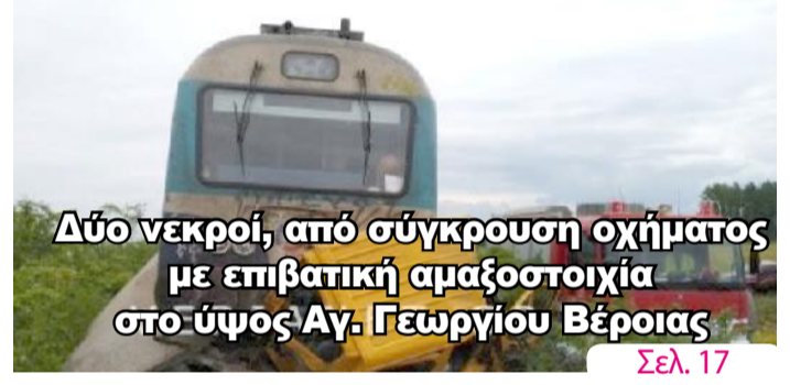
Δύο νεκροί, από σύγκρουση οχήματος με επιβατική αμαξοστοιχία στο ύψος Αγ. Γεωργίου Βέροιας