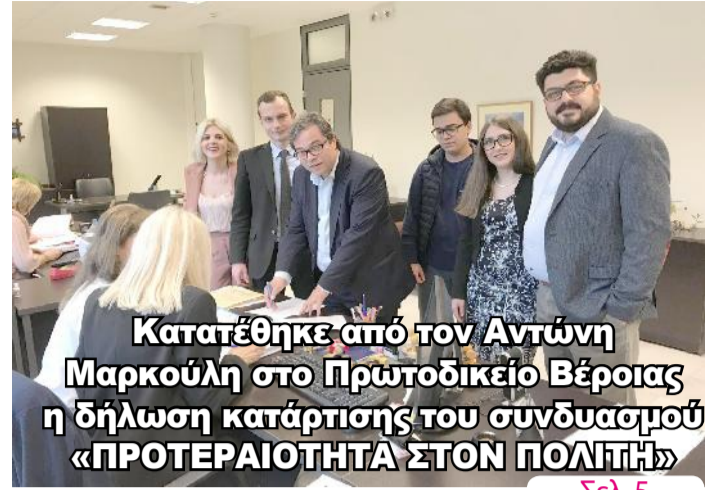
Κατατέθηκε από τον Αντώνη Μαρκούλη στο Πρωτοδικείο Βέροιας η δήλωση κατάρτισης του συνδυασμού «ΠΡΟΤΕΡΑΙΟΤΗΤΑ ΣΤΟΝ ΠΟΛΙΤΗ»