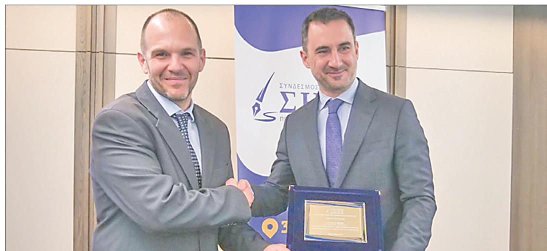
Ο πρόεδρος της Κοινοβουλευτικής Ομάδας της Νέας Αριστεράς Αλέξης Χαρίσιος επέδωσε την πινακίδα στον Γιώργο Μιχαηλόπουλο για την "Εβθευθρία"