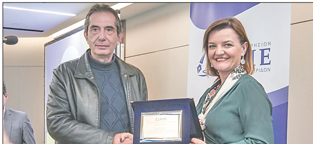
Η Μαρία Κεράβα, ως υφυπουργός Κοινωνικής Συνοχής και Οικογένειας βραβεύει τον ιστορικό εκδότη της εφημερίδας "Πατρὶς" Λεωνίδα Βαρουξή