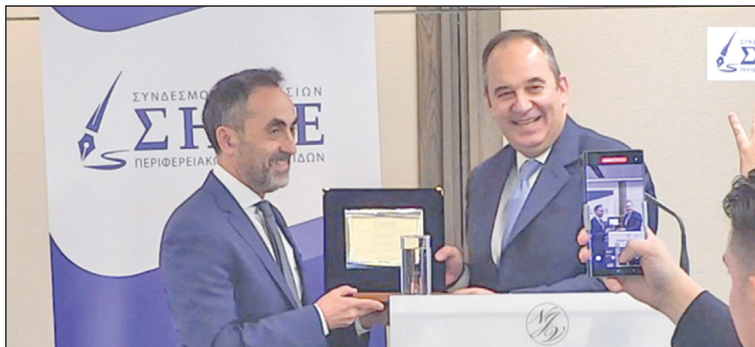
Ο Α' Αντιπρόεδρος της Βουλής Γιάννης Πλακιωτάκης απονέμει τιμητική πινακίδα στον Θεόδωρο Λουλούδη για την εφημερίδα "Πελοπόννησος"

Ο ΣΗΠΕ έχει την τιμή να συγκαταλέγει στους κόλπους του όχι μόνο τις μεγαλύτερες και εγκυρότερες, αλλά και τις αρχαιότερες εφημερίδες της χώρας. Εφημερίδες που βαδίζουν αισίως στον δεύτερο αιώνα της ζωής και της λειτουργίας τους, ένα επίτευγμα μοναδικής και εξέχουσας σημασίας. Εφημερίδες που η διαδρομή τους στο χρόνο, έχει αφήσει ένα ισχυρό αποτύπωμα αντοχής, συνέπειας και διαχρονικής προσφοράς στο χώρο, στον τόπο και τους ανθρώπους!