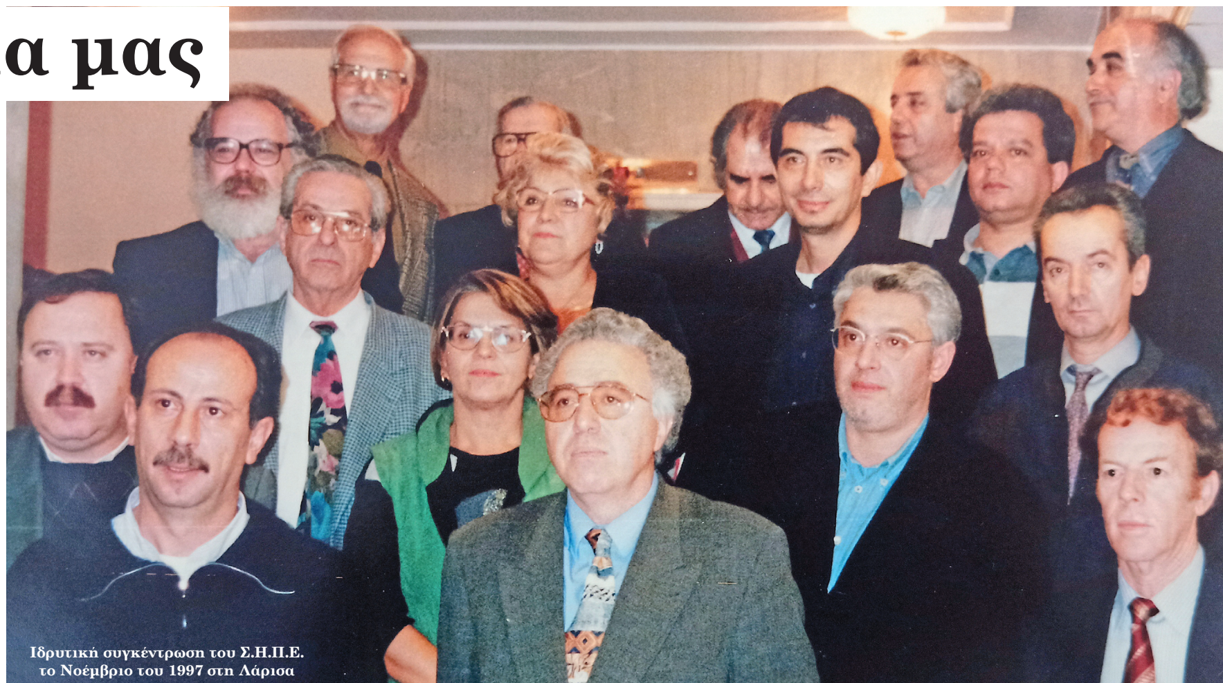
Ιδρυτική συγκέντρωση του Σ.Η.Π.Ε. το Νοέμβριο του 1997 στη Λάρισα

Μετά την διασφάλιση της οικονομικής του αυτοτέλειας, ο ΣΗΠΕ ακολούθησε μία δυναμική πολιτική παρεμβάσεων σε συνεργασία με άλλους φορείς του χώρου των ΜΜΕ, την πανεπιστημιακή κοινότητα, την τοπική αυτοδιοίκηση α' και β' βαθμού, διεθνείς δημοσιογραφικούς φορείς, την Ευρωπαϊκή Ένωση και το Ευρωπαϊκό Κοινοβούλιο. Μέσα σε μία δεκαετία ο ΣΗΠΕ οργάνωσε πάνω από 35 διεθνή συνέδρια, ημερίδες σεμινάρια και εκδηλώσεις ενώ το Νοέμβριο του 2007 ο ΣΗΠΕ έγινε επί-